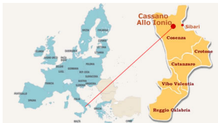
Mappa 1.1 relativa al posizionamento geografico della città di Cassano All'Ionio.

Il comune di Cassano all'Ionio ha un economia a prevalente carattere agricolo inteso come produzione delle materie prime e vendita. In particolare nella piana di Sibari sono presenti numerosi impianti di agrumeti e pescheti mentre nelle restanti aree, quindi nelle zone maggiormente collinari, vengono coltivati principalmente olivi e viti.