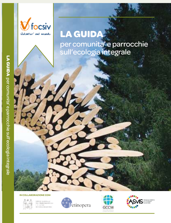
La Guida per comunità e parrocchie sull'Ecologia Integrale 2020 – FOCSIV

Per partecipare è richiesta l'iscrizione e il versamento di una quota di partecipazione di 30€ come impegno di presenza e relativo minimo sostegno ai costi del corso. Ai partecipanti oltre alle lezioni e alla interazione con i relatori verranno forniti materiali come registrazioni, slide e documenti e, su richiesta, un attestato di partecipazione. Per ogni modulo di formazione i Media Partner indicheranno ai partecipanti alcuni testi come suggerimento per l'approfondimento e Avvenire fornirà l'accesso gratuito al quotidiano on line.